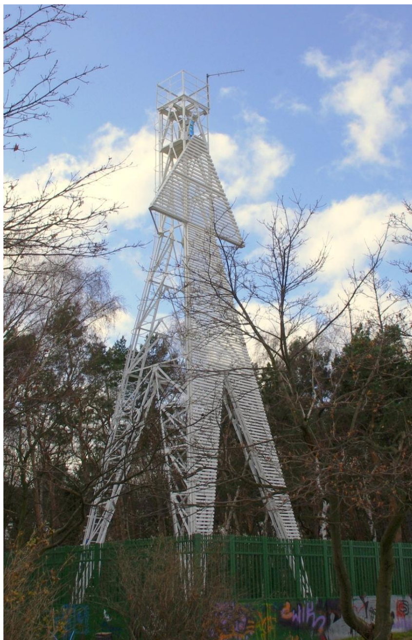
Rys. 1 Stawa dolna nabieżnika Brzeźno