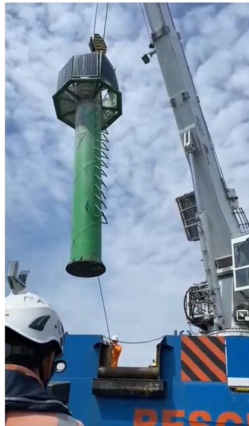
Rysunek 2 Przeniesienie górnej części znaku dźwigiem na pokład jednostki