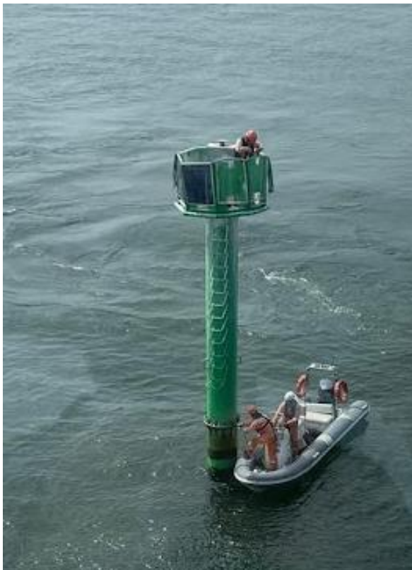
Rysunek 1 Odkręcenie nawodnej części znaku

Zadanie polega na konserwacji nawodnej części znaków przegubowych N1, N2, N5, N6, N8 zlokalizowanych na torze wodnym do Nowego Portu . Zadanie należy wykonać zdejmując nawodną część znaku. Prace z konstrukcją należy przeprowadzić na brzegu. Na czas zdjęcia znaku Wykonawca jest zobowiązany wystawić znak zastępczy. Przykładowy sposób przeprowadzenia zadania wygląda następująco: