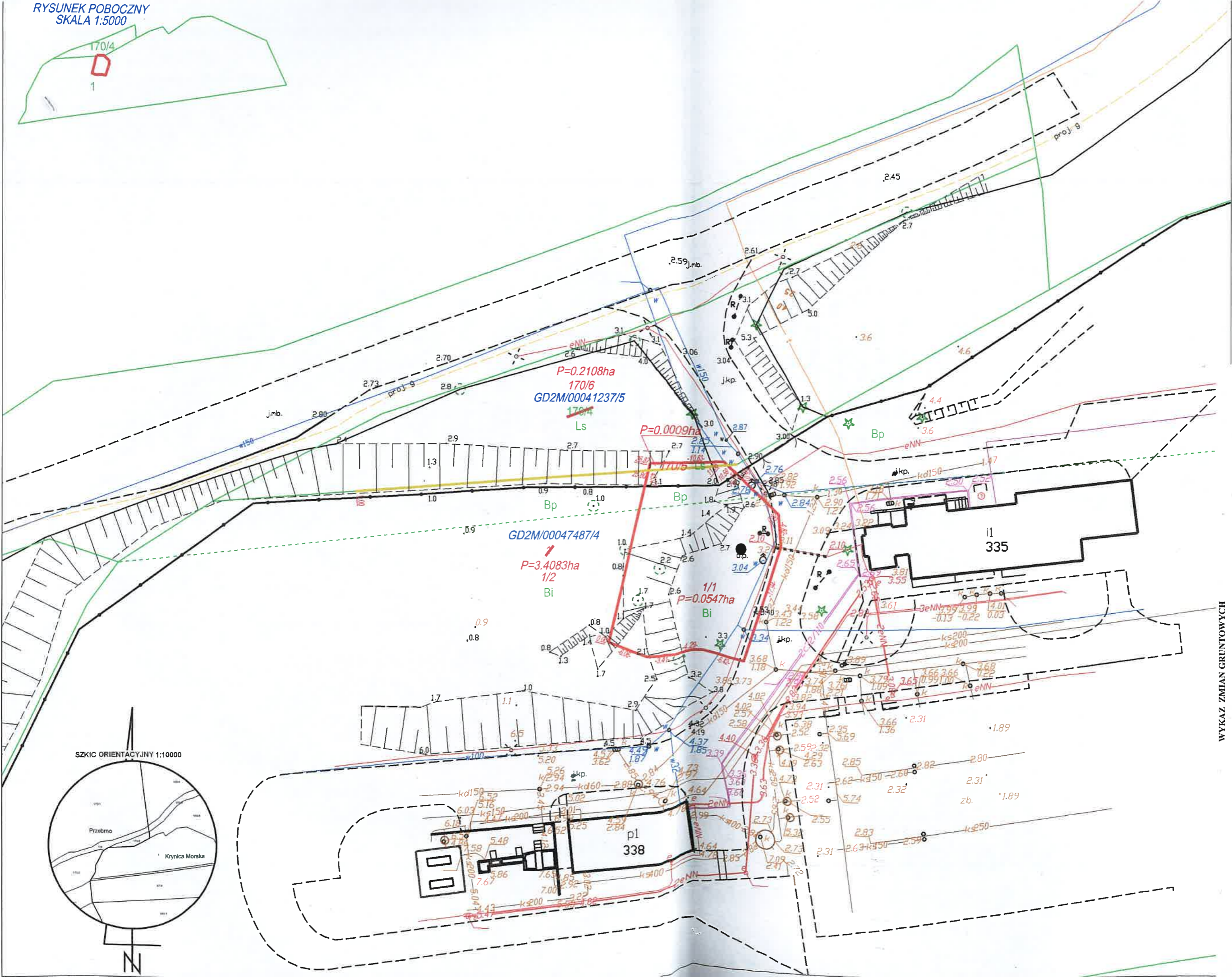
SZKIC ORIENTACYJNY 1:10000